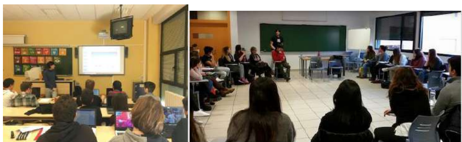
Charla de Fundación Fabre el 26-02-2018 Charla de ONG CEBU el 12-02-2018

En colaboración con el Área de Cooperación Internacional al Desarrollo de la Universidad de Valladolid se llevó a cabo una actividad para acercar la labor de las ONGD al alumnado universitario, en los diferentes Campus de la UVA. Los temas abordados en las sesiones han sido variados: energía sostenible, modelos económicos de crecimiento, Objetivos de Desarrollo Sostenible, género y desarrollo, etc. Participaron 16 ONGD de la Coordinadora realizando charlas en Valladolid, Segovia y Palencia. La actividad se llevó a cabo durante los meses de febrero y marzo de 2018.