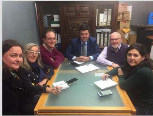
reunión GT Palencia 7 marzo 2018