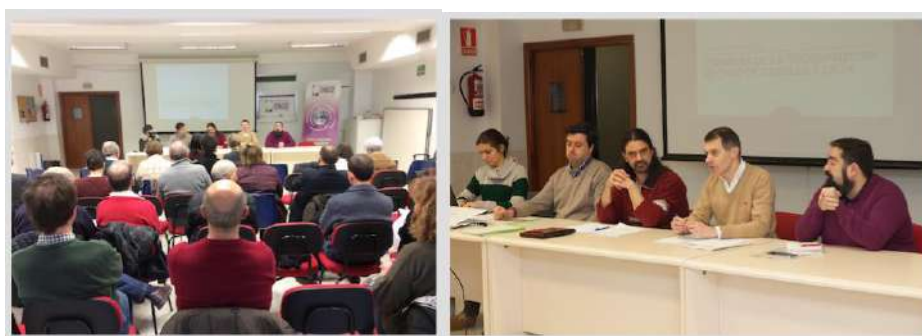
Asamblea de 3 febrero de 2018

Se incorporaron a la Coordinadora dos nuevas entidades: Trabajo Solidario y Voces para Latinoamérica