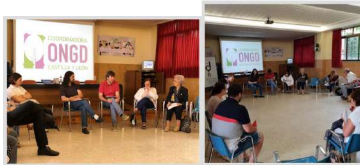
Asamblea CONGDCL de 30 junio de 2018