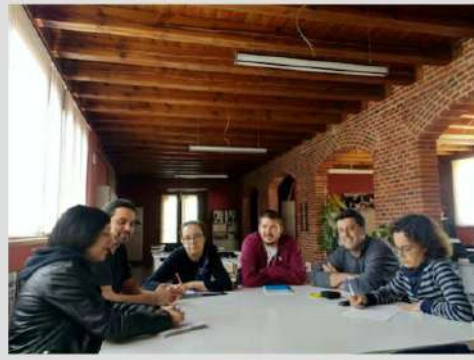
reunión GT Leon - 14 mayo 2018