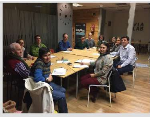
reunión GT Valladolid 16 abril 2018

Igualmente, desde Junta Directiva también se ha participado y dinamizado las reuniones mensuales del Grupo Territorial de Valladolid.