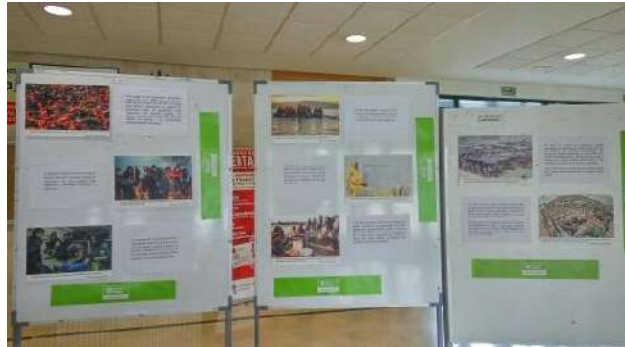
Exposición de OxfamIntermon

Del 19 de marzo al 2 de abril 2018, varios espacios de la ciudad de Burgos acogieron un total de 13 exposiciones de organizaciones del Grupo Territorial de Burgos sobre el trabajo de las entidades burgalesas en cooperación al desarrollo. El objetivo fue acercar el trabajo de estas organizaciones a la ciudadanía y poner en valor la importancia de esa labor.