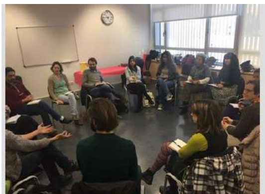
BreakfastYouth, 31 enero 2018

El Presidente de la Coordinadora participó en la edición de enero de esta actividad, organizada por el Espacio Joven, de Valladolid. La actividad tuvo lugar el 31 de enero en el Centro Cívico Canal de Castilla de Valladolid. El tema a abordar fue “Economía y consumo alternativo”. Se reflexionó sobre los hábitos de consumo de los jóvenes, propuestas de economía colaborativa y alternativa y cómo hacer llegar determinados mensajes a la juventud, apostando por un modelo económico y social basado en la justicia y el respeto.