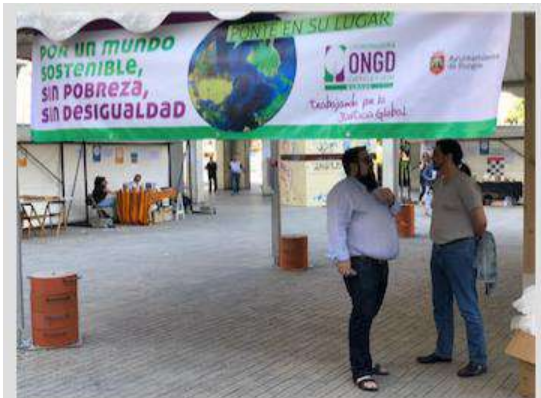
participación JD en Día Solidaridad de Burgos - 16 junio 2018